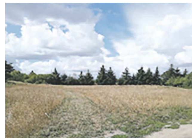
Rarwino działka nr 83/1 obręb 0083. Planowana jest budowa placu zabaw.