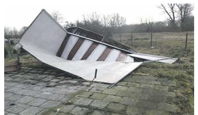
Wiatra przystankowa w miejscowości Kamosowo