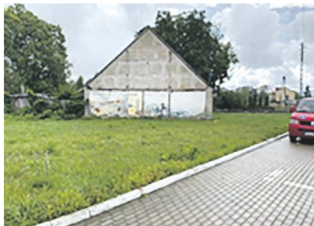
Kościernica działka 174/2 obręb 0027. Planowane jest wybudowanie wiaty piknikowej, siłowni plenerowej i placu zabaw.