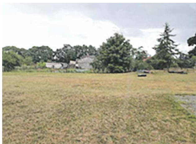
Dębczyno działka nr 224/2 obręb 0069. Planowana jest budowa wiaty piknikowej i placu zabaw