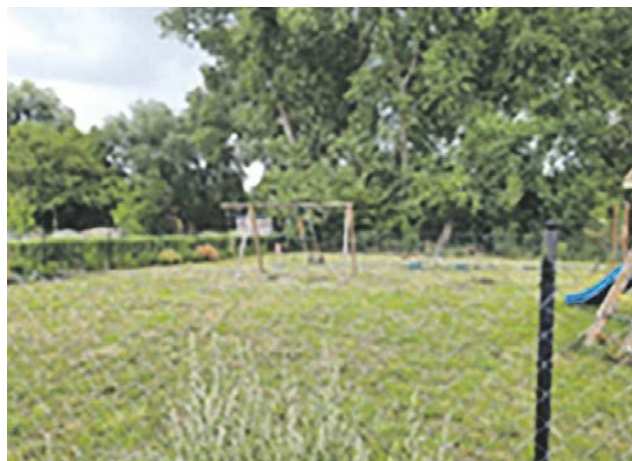
Gruszewo działka 11/39 obręb 0071. Planowana jest budowa placu zabaw.