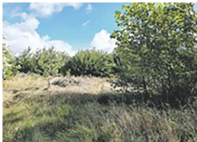
Pomianowo, działka 53/8 obręb 0028. Planowane jest wybudowanie wiaty piknikowej siłowni plenerowej i placu zabaw.