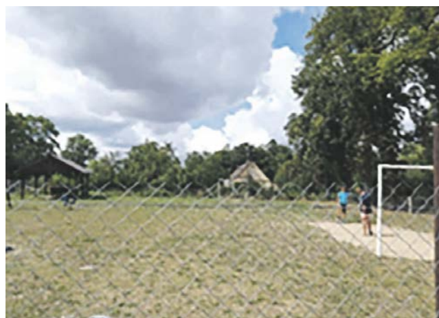
Laski, działka 91 obręb 0073. Planowana jest budowa placu zabaw.