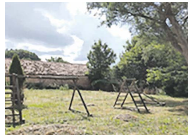
Zagórze działka nr 13 obręb 0079. Planowana jest budowa placu zabaw.