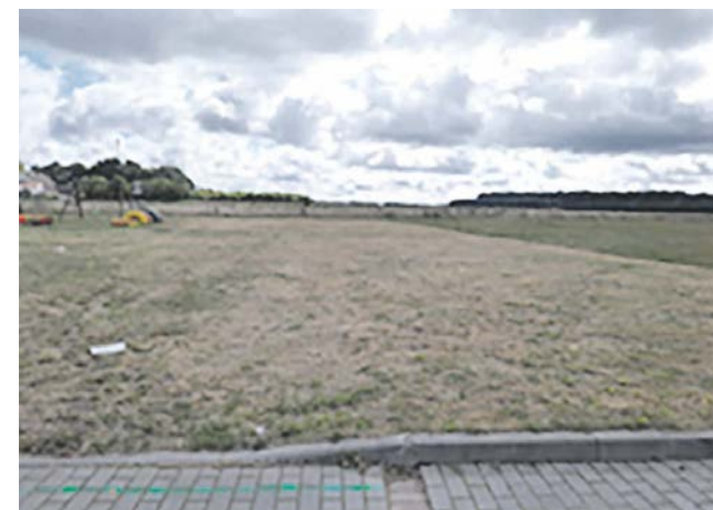
Żeleźno, działka nr 308/3 obręb 0026. Planowana jest budowa siłowni zewnętrznej.