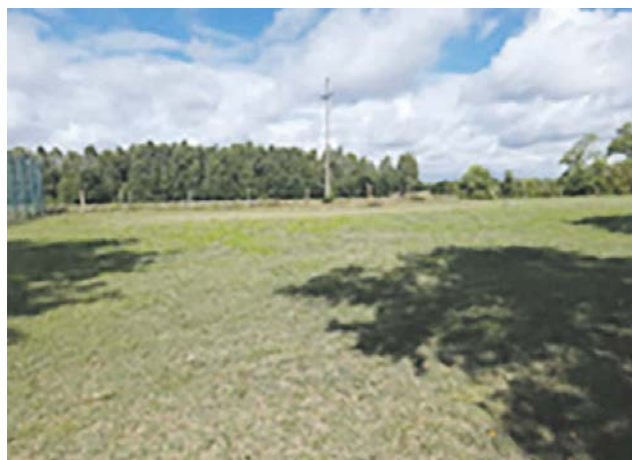
Pomianowo – teren przy szkole, działka nr 196/6 obręb. Planowana jest budowa placu zabaw.